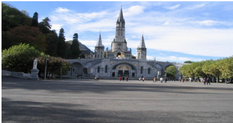
Basilique de Notre-Dame de Lourdes