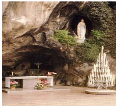
Grotte des apparitions